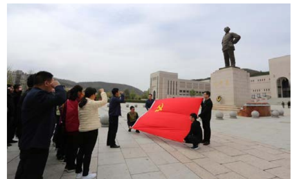
▲ 在延安革命纪念馆广场前重温入党誓词