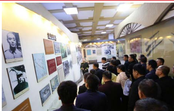
▲ 参观延安抗大纪念馆