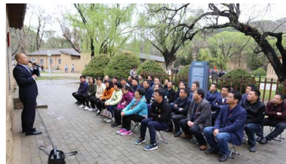
▲ 在延安枣园听《延安时期水乳交融的党群和干群关系》课