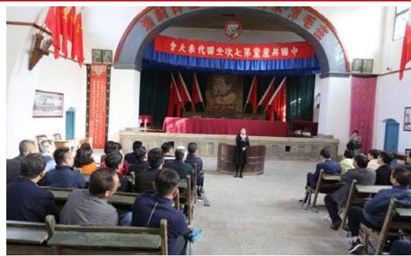
▲ 在杨家岭七大会址旧址听《“窑洞对”及其现实启示》课